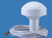
หัวดาวเทียม GPS