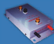
ชุดตัดไฟเกิน